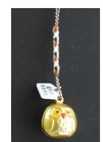
ふくろう守 (魔除け) 800円