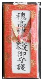
交通安全守 (錦水引掛) 1,200円