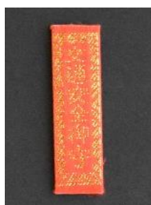
交通安全守 (錦肌守) 500円