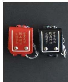
交通安全守 (ランドセル守) 1,000円