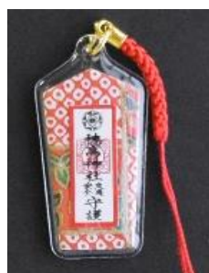
交通安全守 (根付) 800円