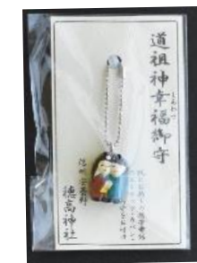
道祖神幸福守 (ストラップ) 800円