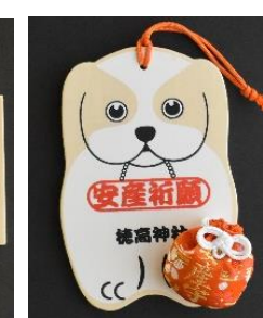
安産守 (お守・絵馬) 1,000円