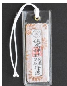
交通安全守 (中抜) 800円