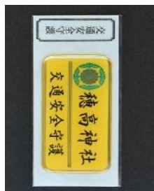
交通安全守 (ステッカー) 800円