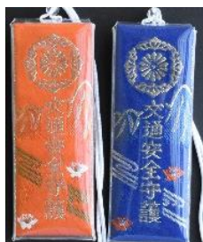
交通安全守 (ビニール入) 1,200円