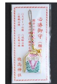
必勝守 (願望成就) 800円