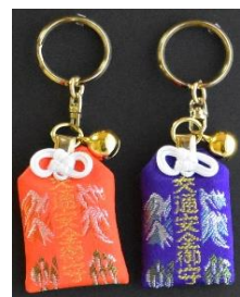
交通安全守 (キーホルダー) 800円