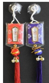
交通安全守 (まり付) 1,000円