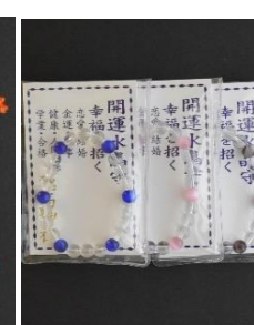
開運プレスレット守 1,500円