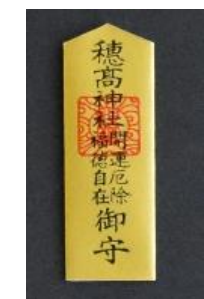
金剣守 (開運厄除) 500円