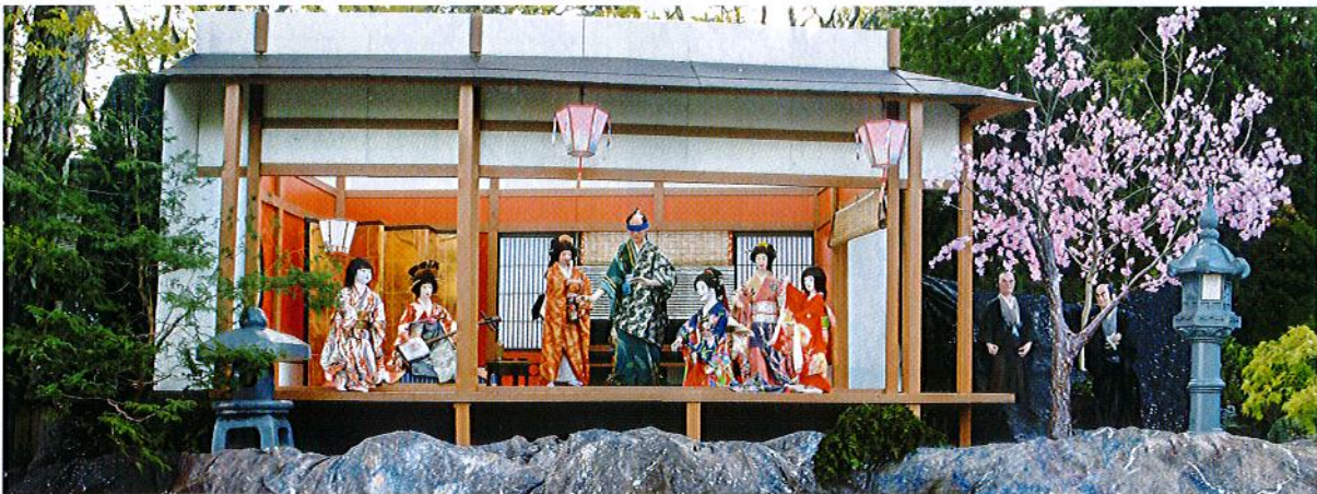
忠臣蔵 一力茶屋 作 穂高睦友社(保尊教室)

多数ご参加頂きますようご案内申し上げます。詳しくは神社までお問い合わせください。状況により変更・中止となる場合があります。