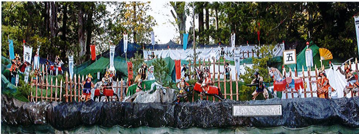
関ヶ原の戦い 作 一真会(小平教室)