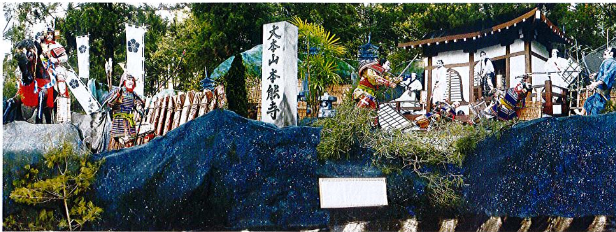
本能寺の変 作 七星会(牛流教室)