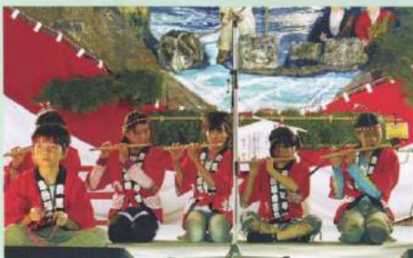
例祭 奉納ステージ