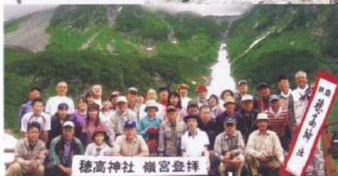
穂高神社 嶺宮登拝