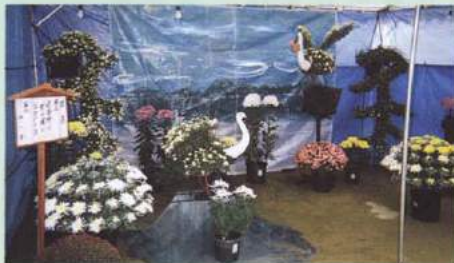
第31回あづみ野菊花品評会