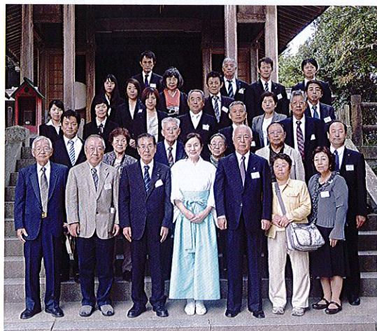
崇敬会、一般参加者 (10月20日～10月22日)