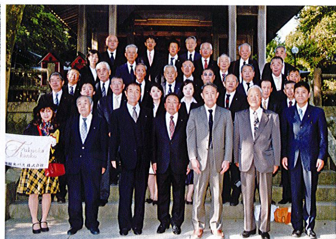
氏子総代 (10月14日～10月16日)