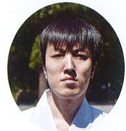
紙幅の關係上詳細 を割愛しますが、私は全くの畑違いからこの世界に入りまし

同様、実家は社家ですが、生まれて此の方、そのことにまるで興味を持たず暮らしてきました。親からもそつした教育を受けたことはありませんでした。その結果、紆余曲折の末神職資格こそ得たものの、知らないことばかりです。当然ながら内心忸怩たる思いはありますが、その反面それが謙虚さにつながるように思われます。