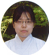
この度、4月1日 より穂高神社に巫女 として奉仕すること となりました。

同様、実家は社家ですが、生まれて此の方、そのことにまるで興味を持たず暮らしてきました。親からもそつした教育を受けたことはありませんでした。その結果、紆余曲折の末神職資格こそ得たものの、知らないことばかりです。当然ながら内心忸怩たる思いはありますが、その反面それが謙虚さにつながるように思われます。