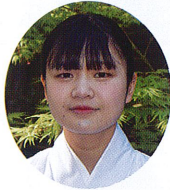
この度4月から正 式に巫女として奉職 させて頂くこととな りました。巫女のア ルバイト経験が全く なく、何も知らない

学生の頃のアルバイトの感覚とは違うところも多くあり、御祈祷や舞など覚えるのが大変です。まだまだ慣れないことも多くあり、先輩方にご迷惑をかけてしまっていますが温かくご指導してくださいとも感謝しております。そんな先輩方の力になれるように、これからも毎日学び続け練習をしていきたいと思