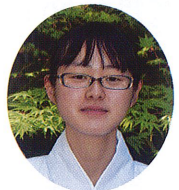
お正月にアルバイ トとしてお世話にな りましたが、この度 として奉仕させて頂 くこととなりました。

慢心することなく、謙虚に学ぶ姿勢を持ち続けること、これを肝に銘じて奉仕していきたいと思っております。